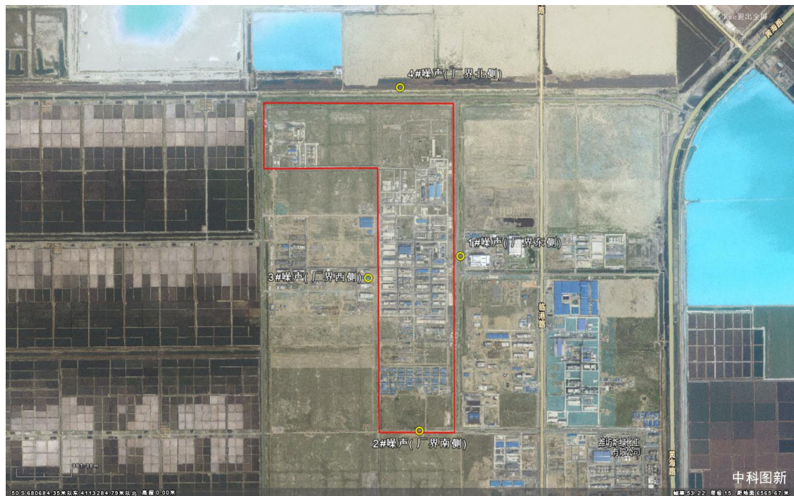
图 7.3.1-1 噪声监测点位示意图